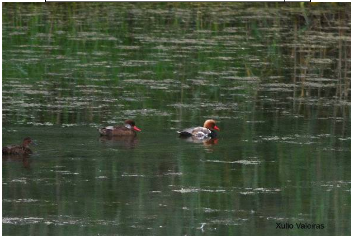
Pato colorado (Netta rufina)