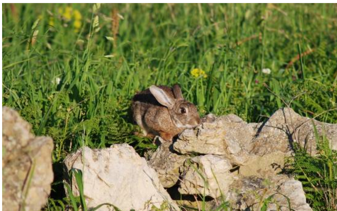
Conejo ( Oryctolagus cuniculus )