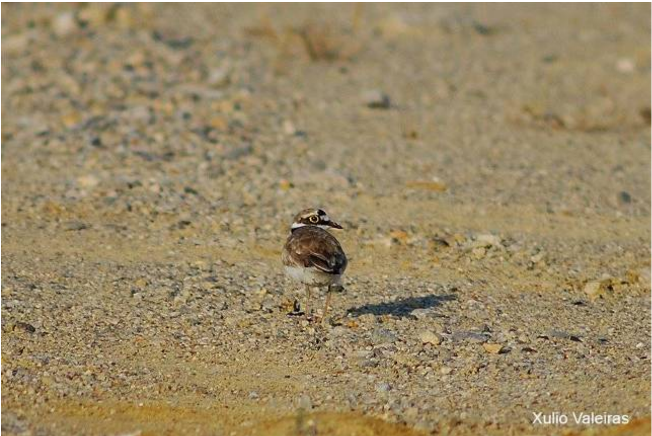
Chorlitejo chico (Charadrius dubius), adulto.