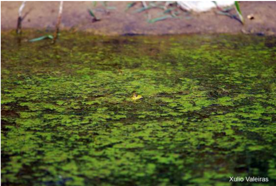
Rana verde ( Rana perezii ) entre la vegetación acuática en una charca en Cuchía.