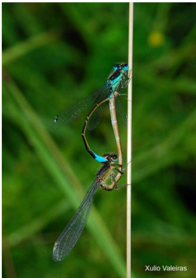
Caballitos del diablo ( Ischnura graellsii ), apareamiento