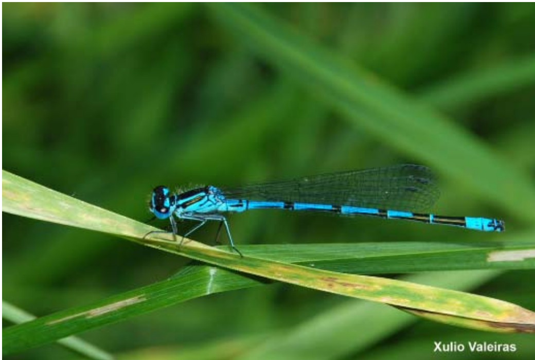
Caballito del diablo ( Coenagrion puella ), macho