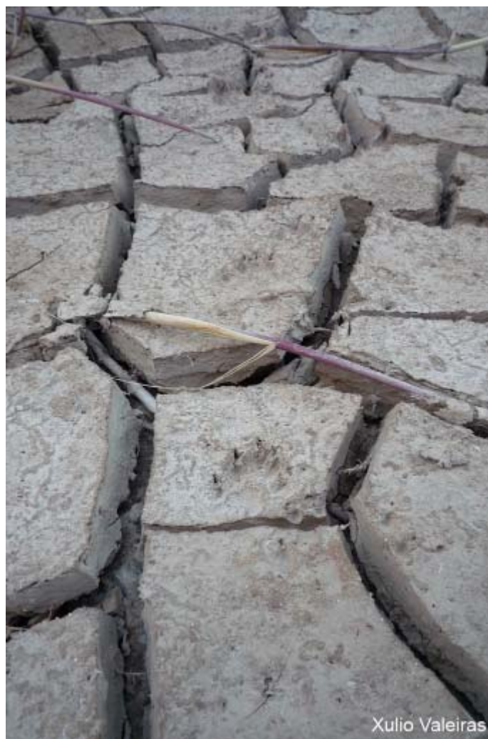
Rastro de Garduña ( Martes foina )