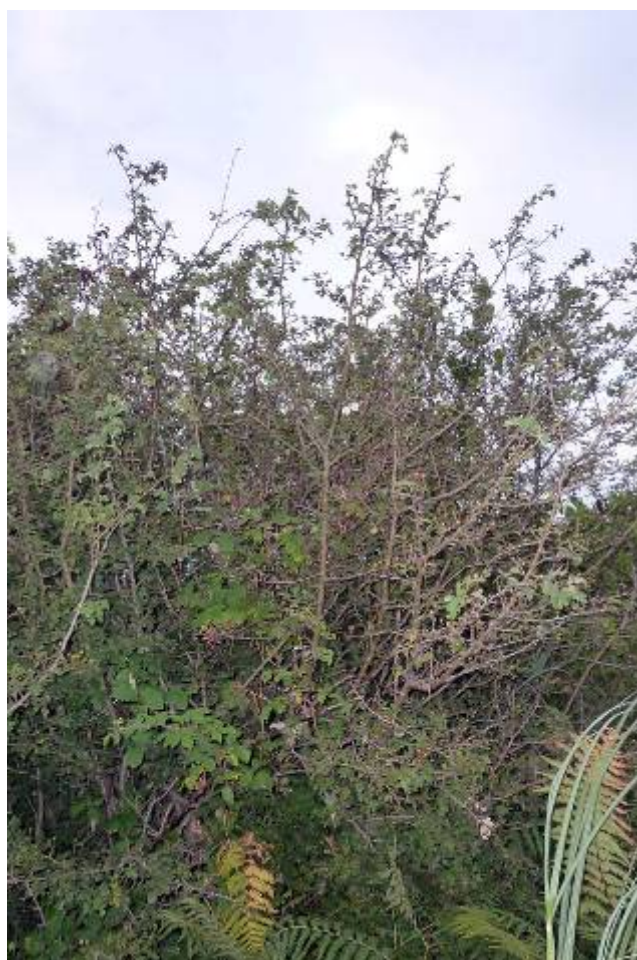
Espino albar ( Crataegus monogyna ) y vegetación de matorral.