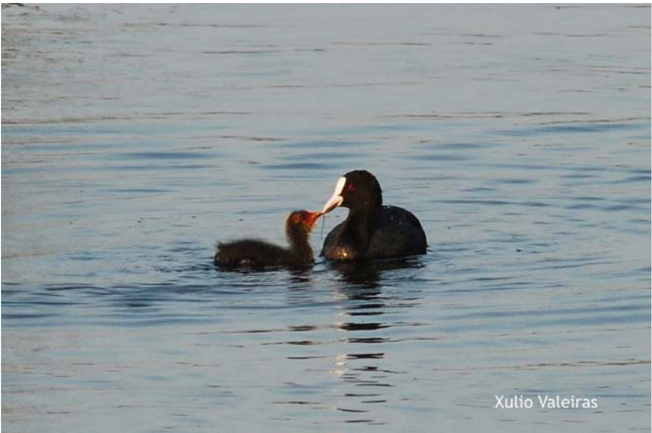
Focha común (Fulica atra) con pollo.