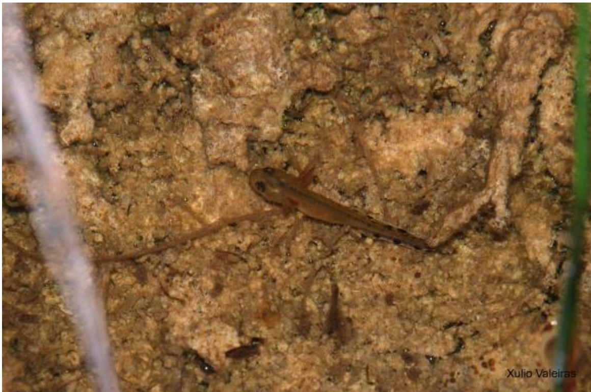
Tritón jaspeado ( Triturus marmoratus ), larva.