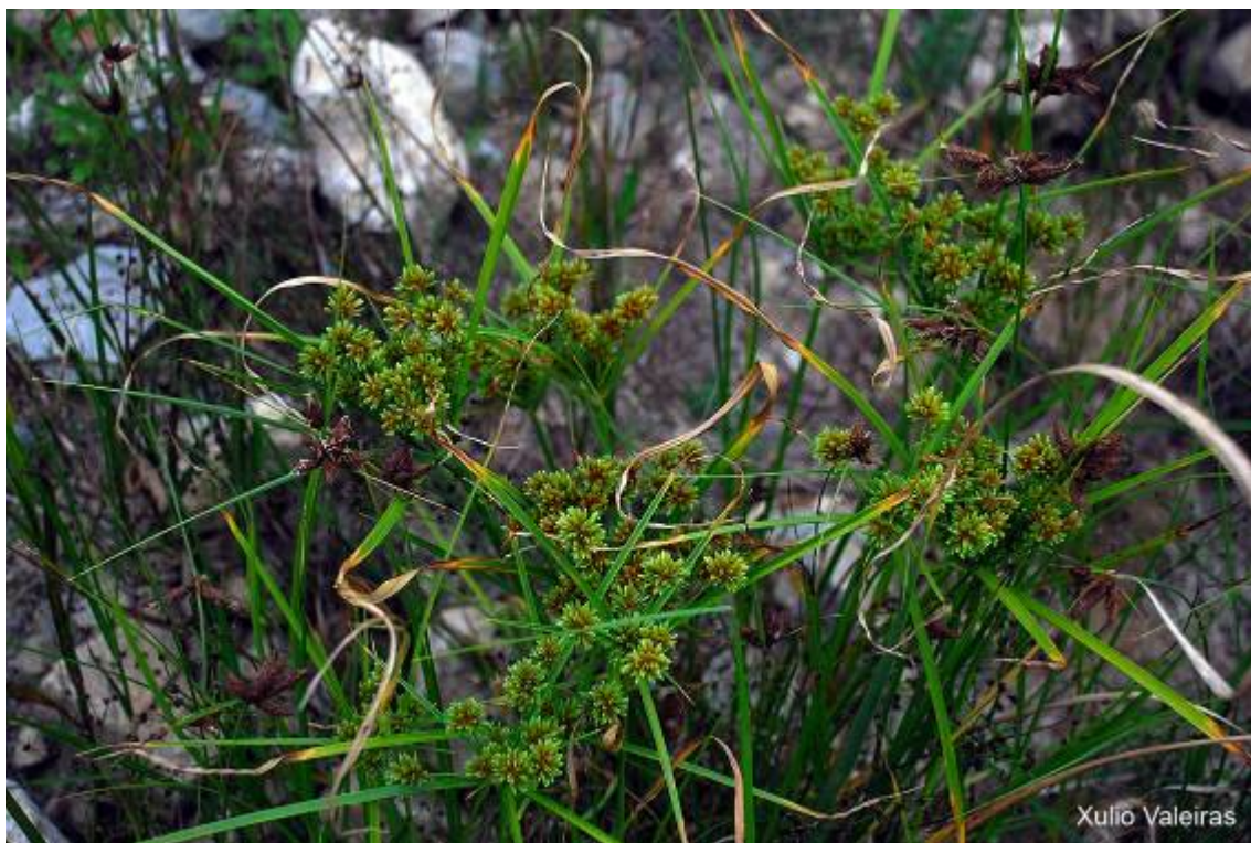
Cortadera ( Cyperus eragrostis )