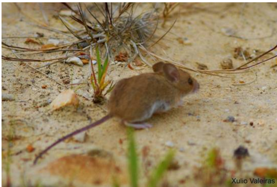
Ratón de campo ( Apodemus sylvaticus )