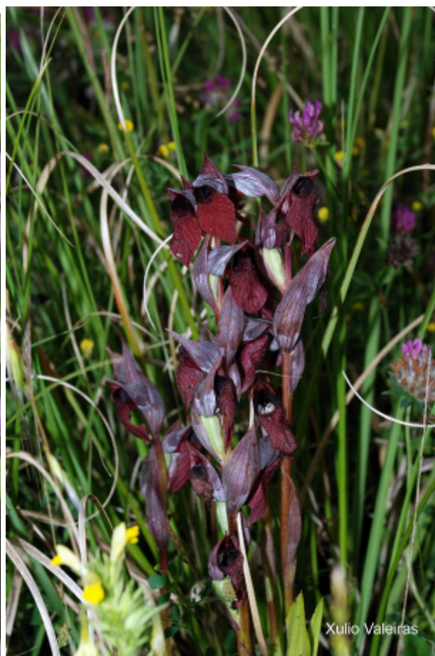
Orquídeas, de izq. a der.: Ophris apifera y Serapias cordigera .