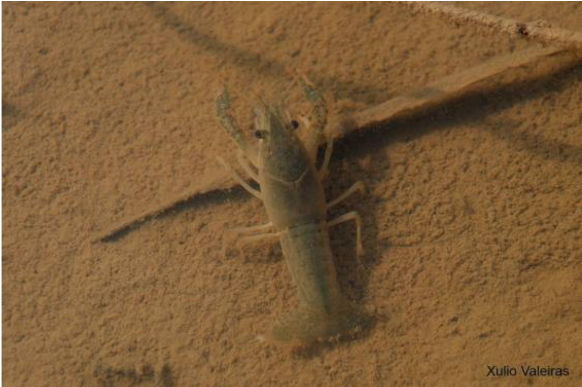
Cangrejo de río americano ( Procambarus clarkii ).