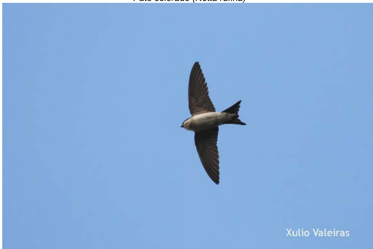
Avión común (Delichon urbica)