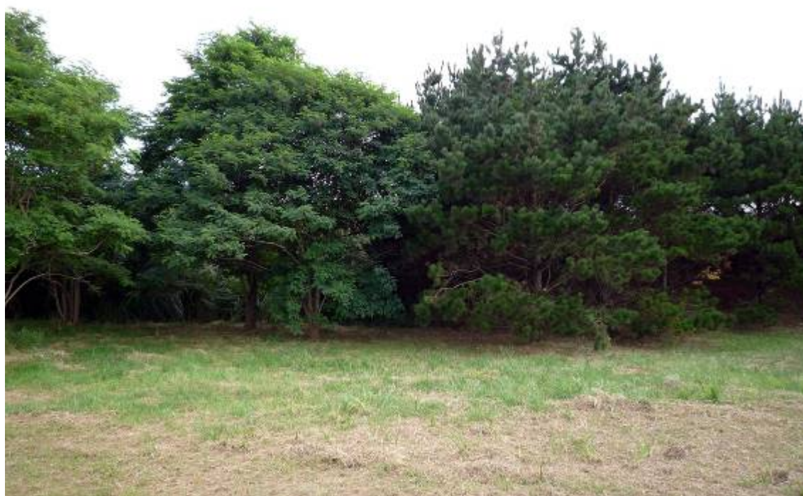
Pino de Monterrey ( Pinus radiata ) y Robinia ( Robinia pseudoacacia ).