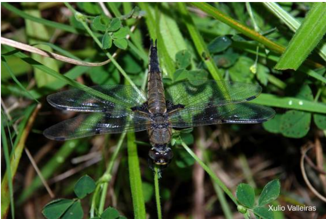
Libélula ( Libellula depressa )