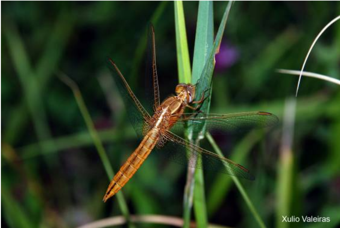
Libélula ( Libellula quadrimaculata )