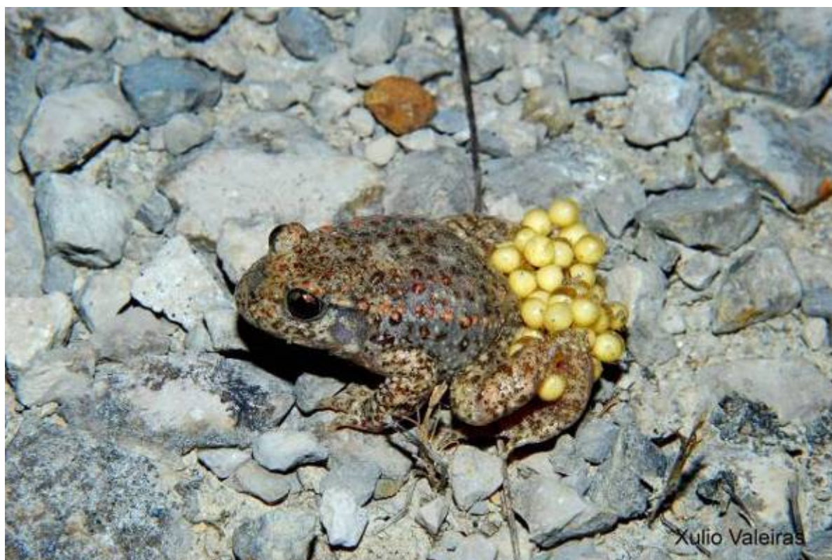
Sapo partero ( Alytes obstetricans ).