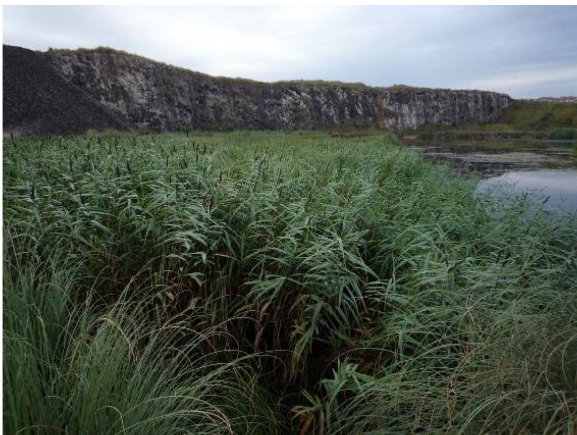
Riberas cubiertas de carrizo ( Phragmites australis )