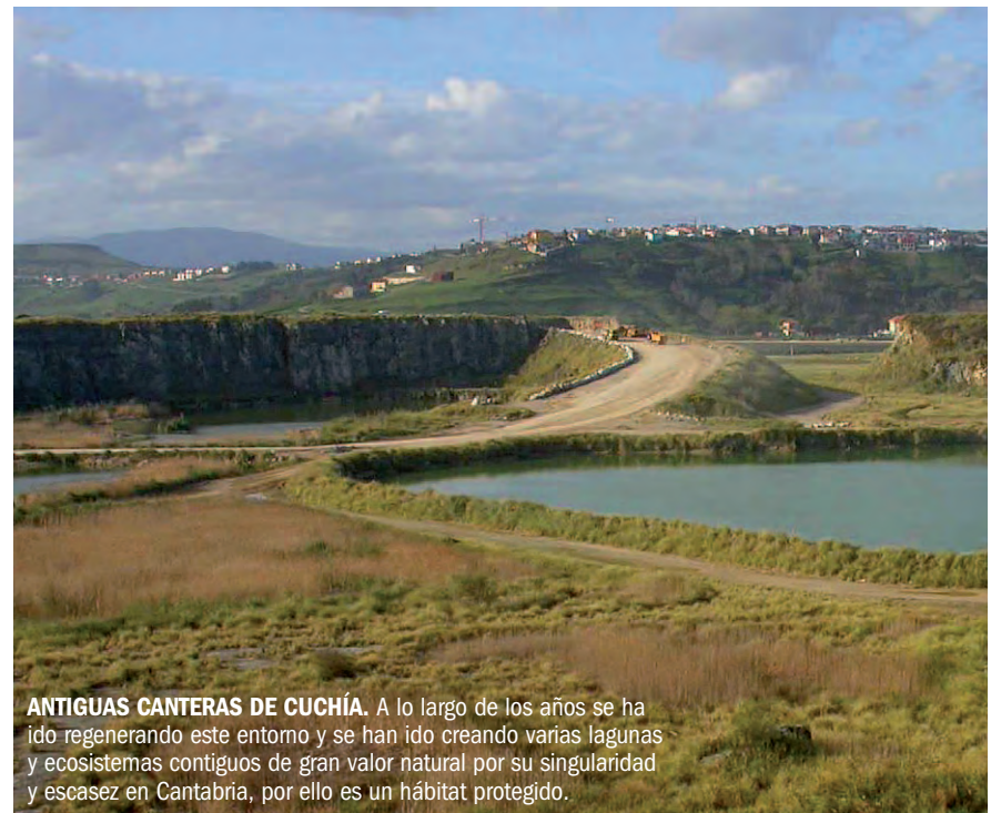
ANTIGUAS CANTERAS DE CUCHÍA. A lo largo de los años se ha ido regenerando este entorno y se han ido creando varias lagunas y ecosistemas contiguos de gran valor natural por su singularidad y escasez en Cantabria, por ello es un hábitat protegido.